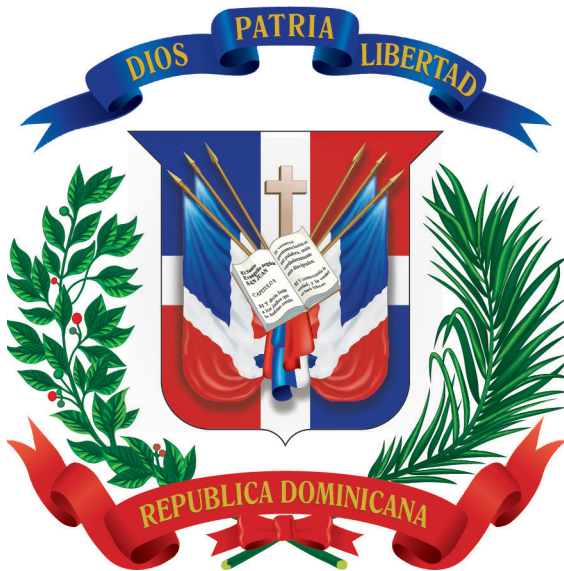
ESCUDO NACIONAL VIGENTE